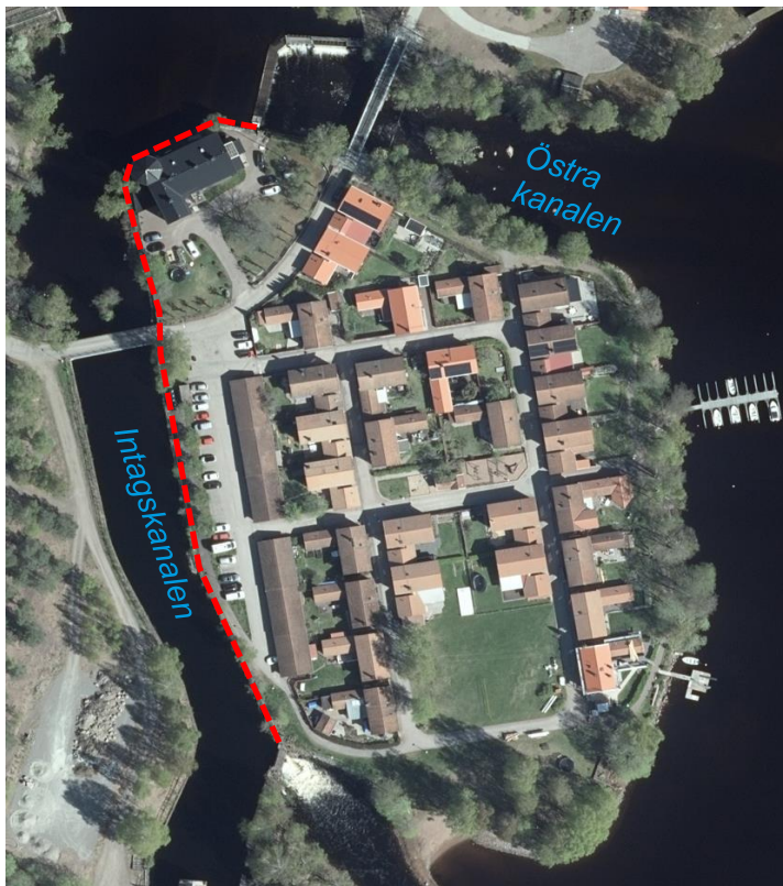
Bilden är en flygbild över Masugnsholmen. Röd streckad linje visar sträckan för potentiellt inläckage.

Vattnet som strömmar genom öns massor tar sig in där vattenståndet är högre än i Runn, vilket omfattar sträckan från östra dammen till det östra utskovet i intagskanalen. Se bild nedan.